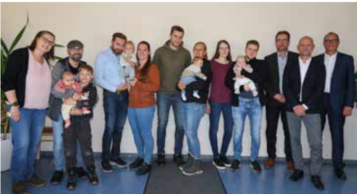
Am 14. Oktober 2024 erhielten 14 kleine Meeranerinnen und Meeraner die „Willkommenspakete für Meeraner Neugeborene“.