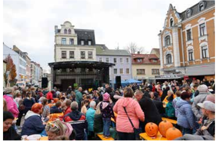
Herbstfest am 31. Oktober 2024 auf dem Meeraner Teichplatz.

Auf der Bühne präsentierten Magier „Julian“, der Chor MERACANTE e.V., ein Gitarrenduo der Freien Jugendkunstschule, Tanzgruppen und der Blasmusikverein Meerane 1968 e.V. stimmungsvolle Programme, für die es viel Applaus vom Publikum gab. Und auch das Wetter spielte – trotz Wolken am Himmel – gut mit!