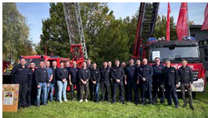
Meeraner und Lörracher Kameradinnen und Kameraden beim „Tag der offenen Tür“ der Feuerwehr Lörrach.