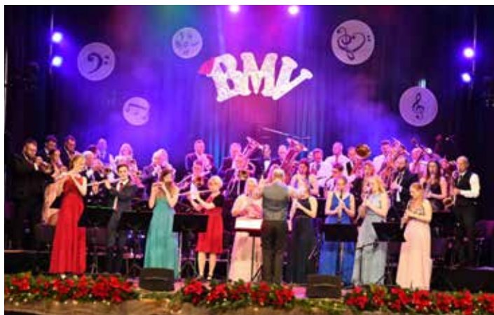
Der Blasmusikverein Meerane 1968 e.V. lädt am 7. Dezember 2024 in die Stadthalle Meerane ein.

Der Eintritt zum Konzert ist frei. Die Musikerinnen und Musiker des Blasmusikvereins und des Nachwuchsorchesters Mini Monkeys freuen sich auf viele Gäste!