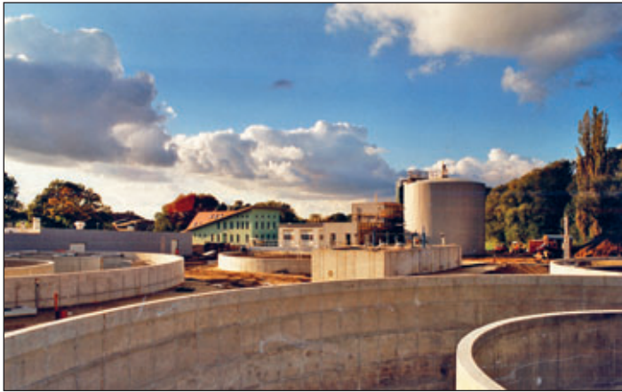
Die neue zentrale Kläranlage des Abwasserzweckverbandes Götzenthal. Das Foto entstand 1999, ein Jahr zuvor wurde die Anlage eingeweiht.

Der Zufluss zur Kläranlage ergab sich weiterhin aus dem „Hauptsammler Meerchen“, so dass der zweite Schritt die Aufgabe hatte, einen ordnungsmäßigen Zufluss zur Kläranlage über einen neuen Hauptsammler mit einem entsprechenden Kanalisationsnetz zu organisieren. Dazu entwickelte der AZV ein auf Meerane bezogenes und genehmigungsbedürftiges Abwasserbeseitigungskonzept (ABK). Das ABK ist pflichtig (§ 51 Sächsisches Wassergesetz) und ist Grundlage für den Erhalt von Fördermitteln durch den Freistaat Sachsen bei Maßnahmen der abwassertechnischen Infrastruktur.