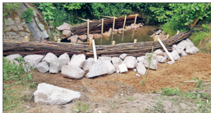
Ufersicherung am Seiferitzbach im Bereich Höckendorfer Straße.

Die frische Weidenfaschine bietet im Gegensatz zu Totholzfaschinen Vorteile, da diese austreibt und die Weiden mit ihrem Wurzelwachstum zur Uferbefestigung beitragen.