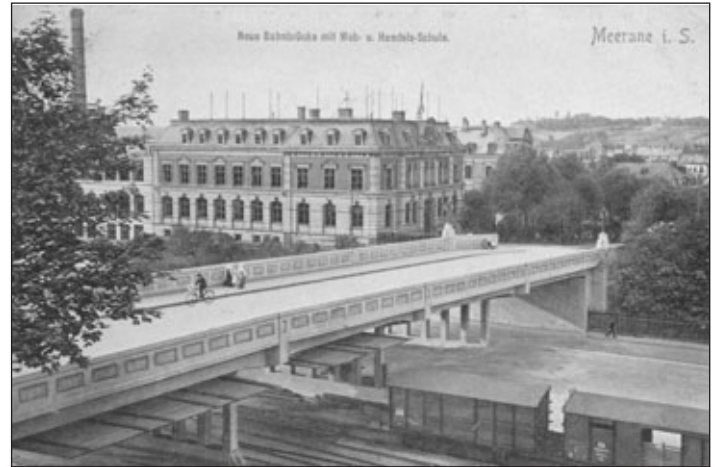
Die steinerne Eisenbahnbrücke (Foto oben) und die 1873 eingeweihte neue Eisenbahnbrücke.

Vor 150 Jahren Am 26. Juni 1872 nachts 1 Uhr wurde die alte steinerne Eisenbahnbrücke an der Crimmitschauer Straße gesprengt. Die neue Eisenbahnbrücke, heute die Brücke „Meer 38“ wurde im Mai 1873 fertig.