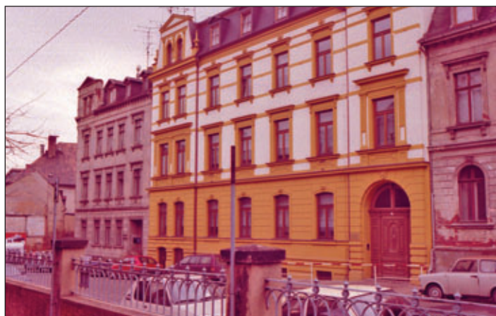
Die „Albert-Schweitzer-Schule“ in der Leipziger Straße 1992.

Die Lernförderschule wurde Ostern 1898 als heilpädagogische Sonderschule für geistige behinderte Kinder mit Ziel der Eingliederung und Erwerbsfähigkeit mit zunächst zwei Klassen eröffnet. Ab Ostern 1905 bis 1945 waren es vier Klassen, die von drei Lehrern unterrichtet wurden. Bis 1923 war die Schule Bestandteil der Bezirksschule I (heutige IOM), seit 1930 war sie in der Georgenschule (heutiges IGM) untergebracht. Seit dem 27.06.1953 befand sich die Förderschule für Lernbehinderte in der Leipziger Straße 17, einem ehemaligen Lagerhaus der Firma Bohrisch, welches 1870 als Prokuristenhaus gebaut wurde. 1988 musste die ganze Schule aufgrund eines Essenbrandes ausgelagert und der Unterricht bis Juli 1989 in den Horträumen der Pestalozzi-Oberschule in der Wehrgasse provisorisch durchgeführt werden. 1989 – 1991 erfolgte die Rekonstruktion des alten Schulgebäudes mit dem Einbau neuer Fenster sowie neuen Heizungs- und Sanitäreanlagen. 1989 – 1991 lernten die unteren Klassen in der heutigen Tännichtschule und die oberen Klassen weiter in der Pestalozzi-Oberschule. Am 01.10.1991 wurde die Wiedereröffnung der