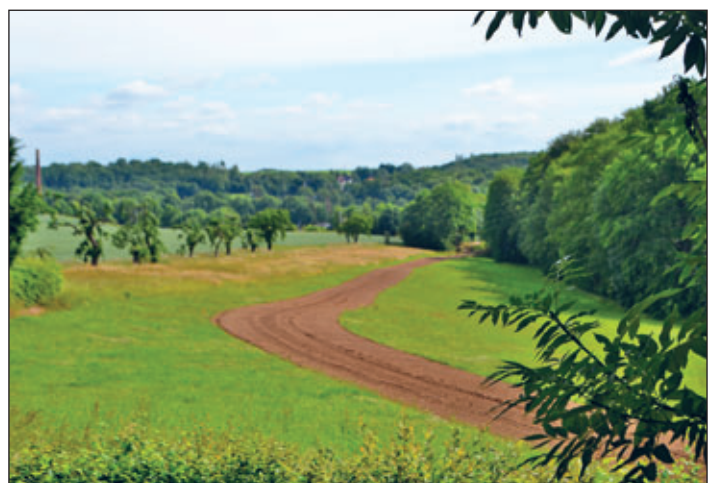
Mitte Juni 2022 haben die Arbeiten für den neuen Geh- und Radweg im Rahmen des Vorhabens „Brumms Grund“ begonnen.

Am 14. Juni 2022 haben die Arbeiten für das Vorhaben Umgestaltung „Brumms Grund“ nördlich der Schwanefelder Straße begonnen. Die Umgestaltung beinhaltet einen Geh- und Radwegebau, der die Schwanefelder Straße mit dem Parkplatz Nelkenweg und im weiteren Verlauf mit dem Meerchenwald verbindet (Länge 475 Meter, Breite 2,50 Meter).