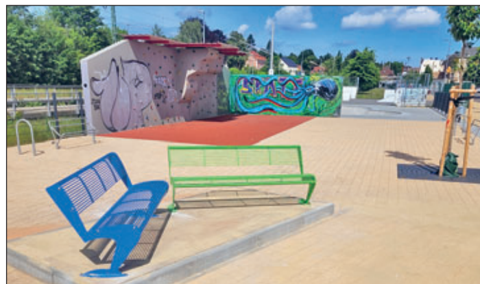
Mitarbeiter der Meeraner Stadttechnik haben die beiden Bänke auf dem vorhandenen Podest aufgebaut.

Zwei neue Bänke wurden in der Freizeitanlage an der Bahn aufgestellt, am Standort des früheren Containers. Die beiden Bänke sind eine Spende der Fördergemeinschaft „Mehr Meerane“ für die Freizeitanlage; dafür ein herzliches Dankeschön der Stadt Meerane.