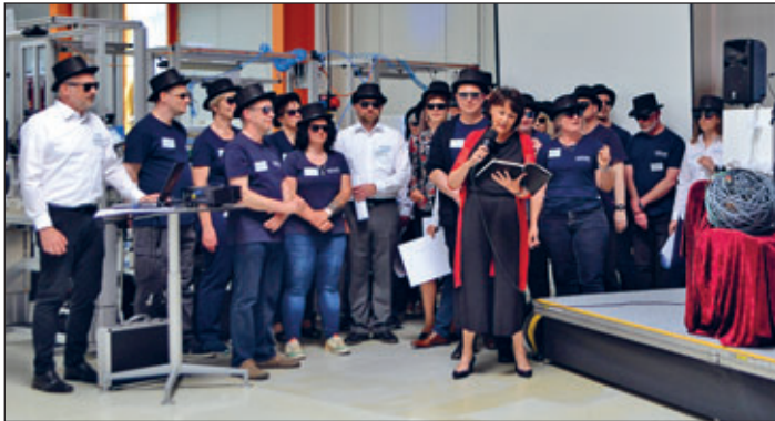
Die Gäste aus dem kurfürstlichen Sachsen – August der Starke und Gräfin Cosel – brachten es auf den Punkt: Sächsisches Improvisationstalent und Schweizer Präzision sind bei Kistler in Meerane bestens verbunden!