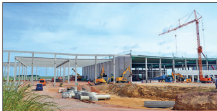
Das Foto zeigt den Baustand am 15. Juni 2022.

Die neue Halle 7 im Industriepark Meerane nimmt immer mehr Gestalt an. Die Grundsteinlegung war am 25. April 2022 erfolgt; im Dezember 2022 soll die Halle weitgehend fertiggestellt sein. Sie wird von Volkswagen künftig als Logistikzentrum für sein Plattformgeschäft genutzt. Im Zentrum steht die Elektroplattform MEB, die ab 2023 auch bei externen Partnern zum Einsatz kommt. Bauherr, Investor und Vermieter der neuen Halle ist die metaWERK AG.