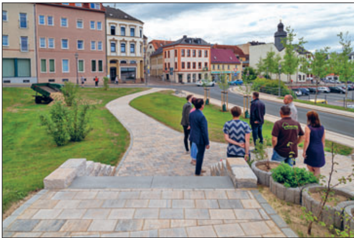
Der Stadtgarten Augasse zur Einweihung am 25. Mai 2022.