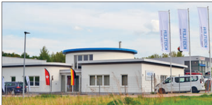
Mit dem Umzug 2019 hat sich die Produktions- und Verwaltungsfläche des Kistler Standorts im Meeraner Gewerbegebiet verdoppelt.