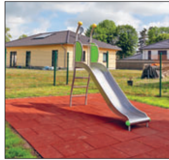
Der neue Spielplatz an der Schmiederstraße. Der Regiebetrieb Meeraner Stadttechnik hat die Montage und Herstellung des Spielplatzes übernommen.