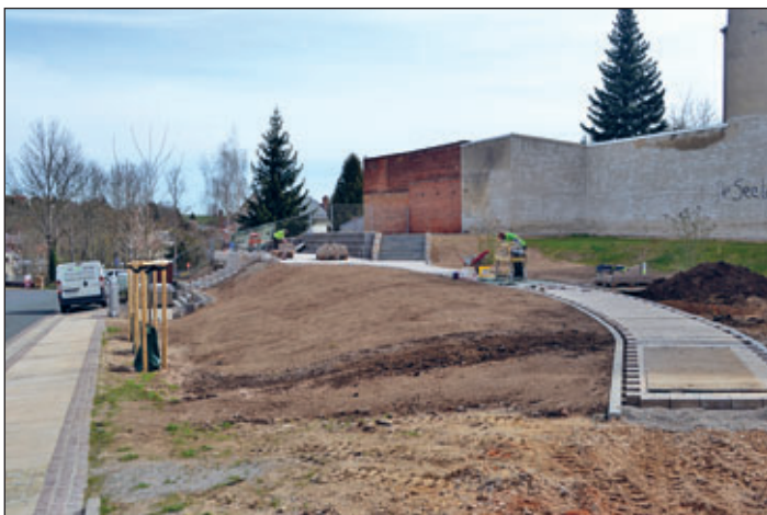
Während der Bauarbeiten Anfang April 2022.

■ Die Stadt Meerane aktuell im Internet und auf Facebook www.meerane.de