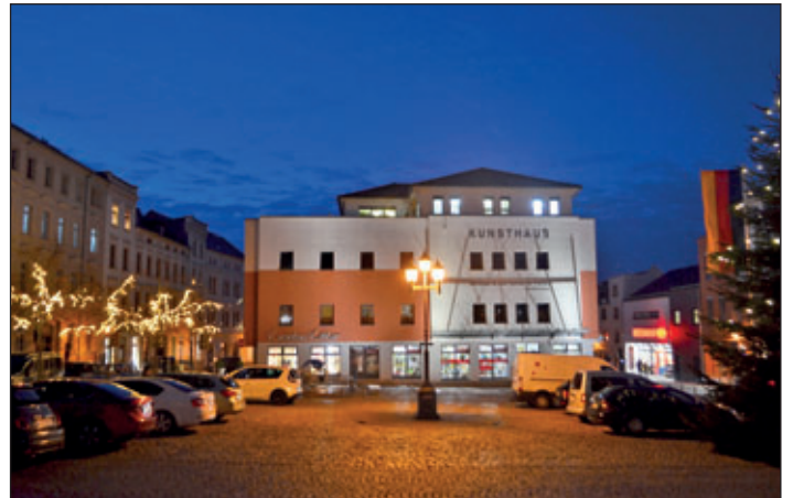
Die Meeraner Innenstadt – Teichplatz, August-Bebel-Straße, Poststraße und Markt – weihnachtlich geschmückt in der Adventszeit.