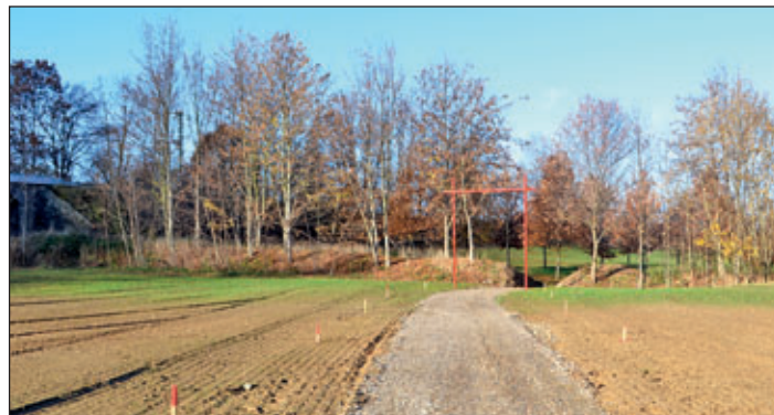
Die Aufnahmen auf dem Gelände entstanden am 23. November 2020.