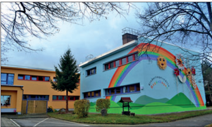
Die neue Fassadengestaltung der Kita „Regenbogen“.

Die bereits vorhandenen Fassadenelemente – Sonne, Blumen und Blumen-Uhr – wurden vor der Sanierung demontiert und instand gesetzt. Diese Schmuckelemente sorgen nun gemeinsam mit dem bunten Regenbogen auf blauem Hintergrund, einer angedeuteten Hügelandschaft am Fuß des Gebäudes und dem Schriftzug „Kindertagesstätte Regenbogen“ für einen strahlenden „Hingucker“!