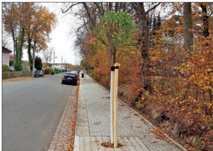
Kugel-Robinien wurden in der Stadionallee gepflanzt.

Die Meeraner Stadionallee hat Mitte November 2020 acht neue Bäume – Kugel-Robinien – bekommen. Vorausgegangen war von Mitte Mai bis Ende Juli 2020 die Sanierung des Fußweges auf der rechten Straßenseite in Richtung Richard-Hofmann-Stadion. Der Fußweg hat auf ca. 350 Metern neues Betonpflaster erhalten. Die vorhandenen Borde wurden neu gesetzt, ebenso das Großpflaster im Schnittgerinne. Bereits vorbereitet wurden auch die acht Baumscheiben. Entsprechend der Vegetationsperiode der Bäume ist nun die Pflanzung erfolgt.