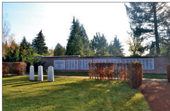
Gedenkstunde zum Volkstrauertag am 15. November 2020 und Enthüllung der Gedenktafeln am Ehrenmal Zweiter Weltkrieg auf dem Friedhof Meerane.