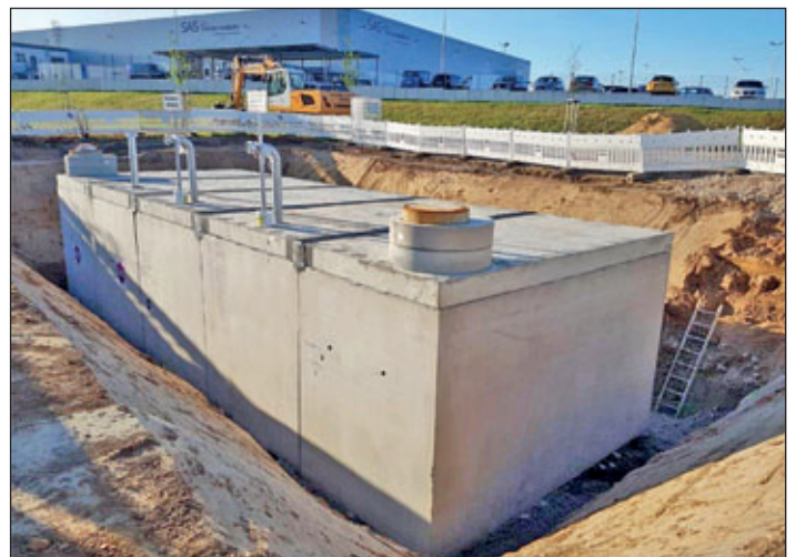
Im September 2020 wurden die Baugrube für die Löschwasserzisterne ausgehoben und die Zisterne eingesetzt.

Die Löschwasserzisterne 1, die ebenfalls über ein Volumen von 200 Kubikmetern verfügt, wurde Anfang 2019 fertiggestellt. Beide Zisternen, die der Löschwasserversorgung des gesamten Industrieparkes dienen, liegen an der neuen S 288.