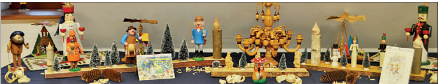
Das Heimatmuseum im Alten Rathaus kann aufgrund der aktuellen Beschränkungen derzeit nicht öffnen. Einen kleinen virtuellen Rundgang durch die Weihnachtsausstellung im Heimatmuseum gibt es unter www.meerane.de sowie auf der Facebookseite der Stadtverwaltung.