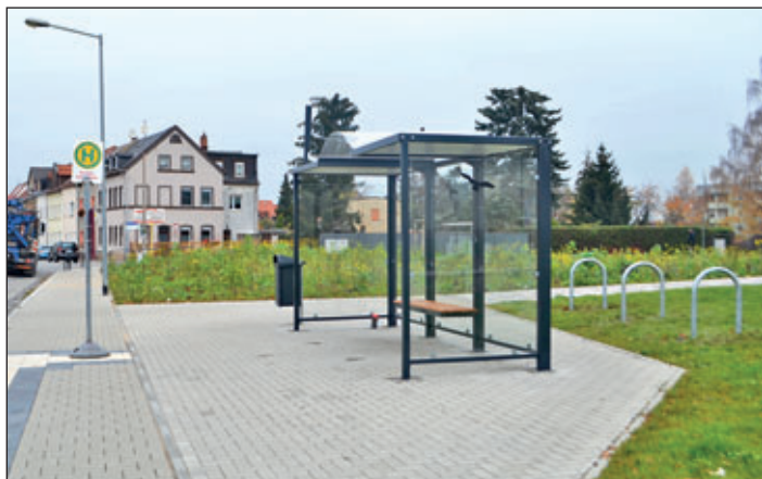
Neugestaltung „Platz an der alten Weinbrennerei“. Die Fotos zeigen den Baustand Mitte November 2020.

Bereits im Frühjahr 2020 wurden der Gehweg entlang der Glauchauer Straße neu hergestellt und der Bereich der Bushaltestelle behindertengerecht ausgebaut. Im Mai 2020 erhielt der Platz eine Wegquerung. Eine Schmetterlingswiese mit verschiedenen Blumen und Pflanzen wurde im August angesät.