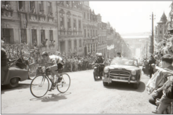
Friedensfahrt 1953.