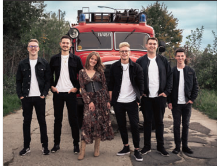
„Rock Ambulance – Die Partyband“ sorgt am 23. Juni für den Parkfestaufakt.

Den musikalischen Startschuss für das 51. Parkfest gibt es bereits am Freitagabend (23. Juni) mit „Rock Ambulance – Die Partyband“. Die sechs jungen Musiker präsentieren einen spannenden Mix aus den besten Party- und Rock-Hits der vergangenen Jahrzehnte und werden ihr Publikum auch mit aktuellen Charts und einer mitreißenden Bühnenshow begeistern. „Lass uns rocken bis der Arzt kommt“, so das Motto der aus Zwickau stammenden Band.