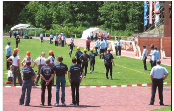
Landesmeisterschaften im Feuerwehrsport im Richard-Hofmann-Stadion

führt, bei denen rund 400 Feuerwehrsportlerinnen und -sportler ihre Leistungsfähigkeit zeigen. In der Karl-Heinz-Freiberger-Sporthalle findet der Delegiertentag des Landesfeuerwehrverbandes statt.