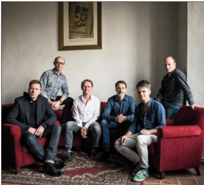
KEIMZEIT steht am 24. Juni auf der Parkfestbühne!

Mit ihren Songs begeistert die Band seit vielen Jahren die Fans. Ironisch, spielerisch und meistens mit einem Augenzwinkern reflektieren sie unser Leben. Mit dem Programm „Von Singapur bis nach Feuerland“ und Songs aus vier Jahrzehnten werden die Kultmusiker zum Meeraner Parkfest für Stimmung sorgen.