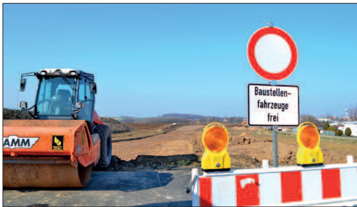
Die Fotos zeigen das Baugeschehen am 24. März 2021.