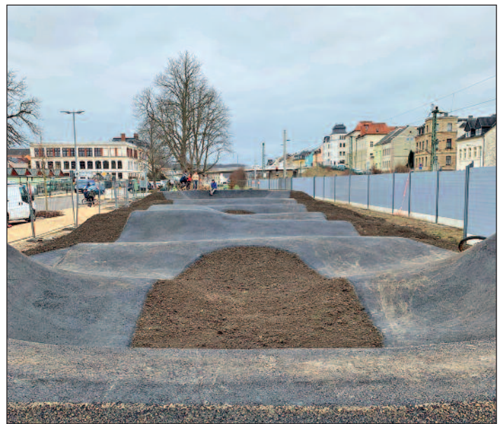
Fotos: IGS Bauüberwachung; Konrad Willar – Pumptracks/ Bike trails/Events