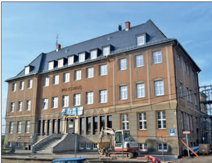
Die Fotos zeigen den Zustand der Fassade des Volkshauses 2016 (Foto oben) und 2020.