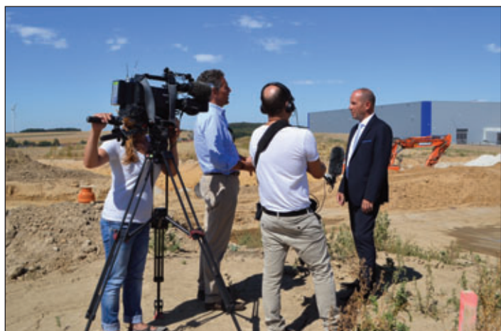
Ein Team des ZDF Landesstudios Sachsen drehte am 6. August 2018 in Meerane.

Ein Team des ZDF Landesstudios Sachsen war am 6. August 2018 in Meerane, um einen Beitrag für das ZDF Heute-Journal zu drehen. Thema waren die Wanderungsbewegungen aus den ländlichen Räumen in die Stadt und der demographische Wandel sowie im Besonderen