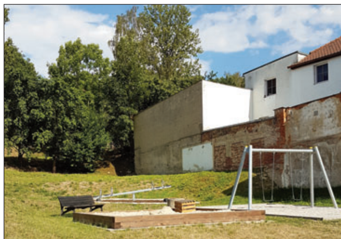
Spielplatz Crotenlaider Weg.