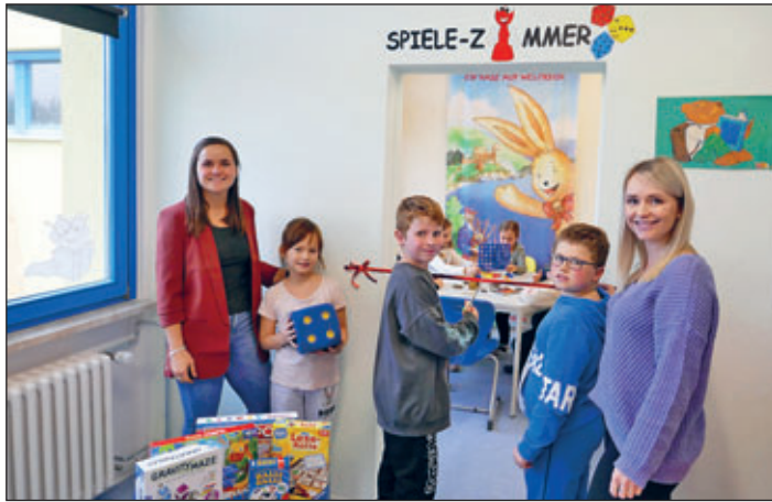
Am 21. November 2023 konnte die Grundschule Friedrich-Engels-Schule ihr neues Spiele-Zimmer eröffnen.

Das Spiele-Zimmer soll einen Ort der realen und sozialen Begegnung für alle am Schulalltag beteiligten Personen schaffen, informierte die Grundschule.