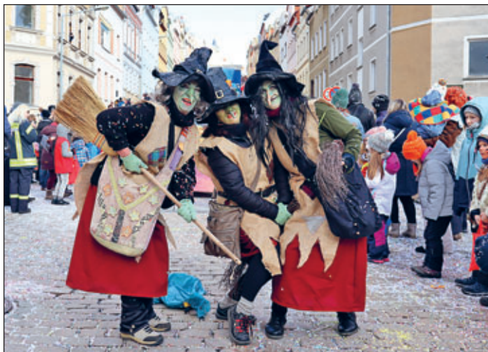
Meeraner Straßenfasching 2023.

Weitere Informationen gibt es auf der Facebook-Seite der Pflasterköpfe.