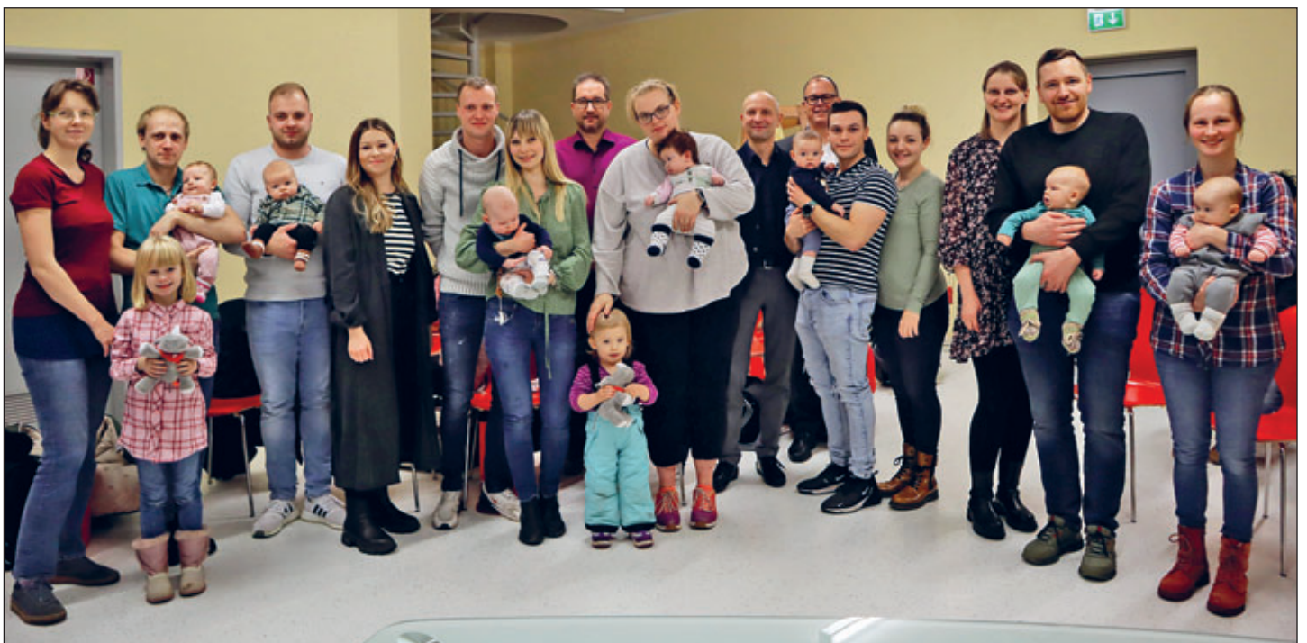
Übergabe der „Willkommenspakete für Meeraner Neugeborene“. Im Trauraum des Höhlermuseums am Teichplatz war am 11. Dezember 2023 der Meeraner Nachwuchs zu Gast.