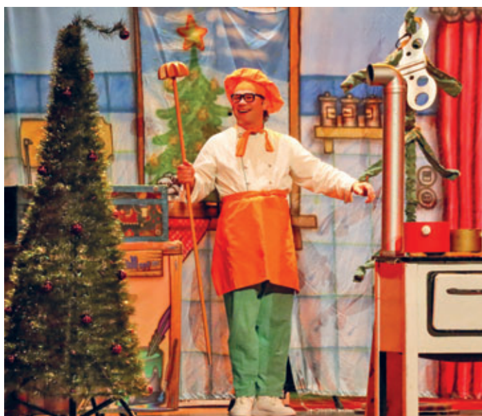
Weihnachtliche Überraschung gelungen: Das Programm „Der Osterhase als Weihnachtsmann, ob man da noch helfen kann“ begeisterte die Meeraner Grundschülerinnen und Grundschüler.