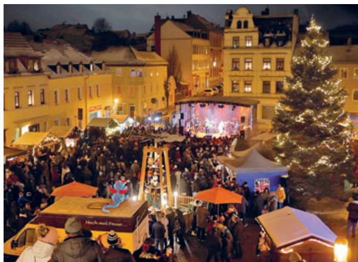
Meeranos heimlicher Besuch auf dem Meeraner Weihnachtsmarkt.