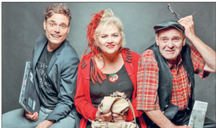
Am 3. März 2024 gastiert das Kabarett Die Herkuleskeule in der Meeraner Stadthalle. Präsentiert wird das Programm „Tunnel in Sicht“.

Karten im Vorverkauf können über Monkey Tickets www.monkey-tickets.de zu 20 Euro zzgl. Gebühren oder an der Abendkasse in der Stadthalle zu 25 Euro erworben werden.