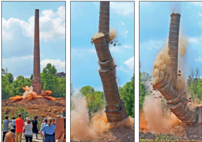
Am 27. Mai 2020 wurde der Schornstein der ehemaligen Kammgarnspinnerei Meerane gesprengt.