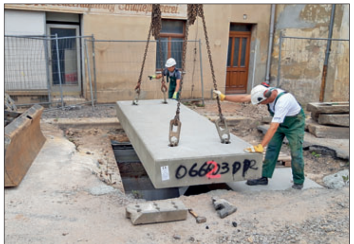
Verschließen der Montageöffnungen/Kopflöcher.

Wir bitten alle Anlieger und Verkehrsteilnehmer um Beachtung und Verständnis!