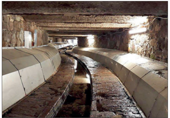
Der Kanal wurde auf einer Länge von rund 220 Metern links- und rechtsseitig auf der Berme des überbauten Dittrichbaches verlegt.

Beim Bau der Trinkwasserleitung muss aufgrund der vorhandenen Bausituation ein anderes, aufwendigeres Verfahren angewandt werden. Verschiedene Abwasserleitungen aus Privatgrundstücken müssen mit einer zusätzlichen Verblechung gesichert werden, um ein Abreißen bei Starkregen zu verhindern. Nachträglich beauftragt wurde durch den Landkreis als Straßenbaulastträger eine Sanierung der Straßeneinläufe. Dazu kommt, dass sich aufgrund der Covid-19-Pandemiesituation die Lieferzeiten der Fertig-