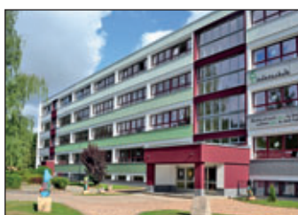
Die Grundschulen Friedrich-Engels-Schule und Lindenschule.

Kriterien für die Entscheidungsfindung sind dabei Wohnortnähe, Beschulung von Geschwisterkindern sowie die Anbindung an den öffentlichen Personennahverkehr. Neben den öffentlichen Grundschulen gibt es auch Grundschulen in freier Trägerschaft, die die Anmeldungen direkt entgegennehmen.