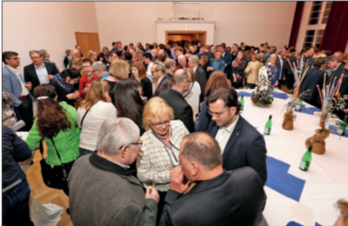
Ausklang des Meeraner Neujahrsempfanges 2020 im Kleinen Saal sowie Foyer bei vielfältigen Begegnungen und Gesprächen. (Weitere Fotos auf www.meerane.de )