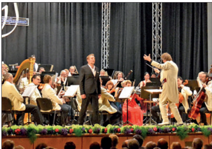
Neujahrskonzert 2020 mit der Vogtland Philharmonie in der Meeraner Stadthalle.

Zu hören waren Ausschnitte bekannter Opern, Operetten und Musicals, darunter aus „Der Barbier von Sevilla“, „Romeo et Juliette“, „Hoffmanns Erzählungen“, „Das Land des Lächelns“, „My Fair Lady“ oder „West Side Story“. Ein Genuss für Ohren und Augen! Das Publikum dankte am Ende mit großem Applaus für einen gelungenen musikalischen Nachmittag!