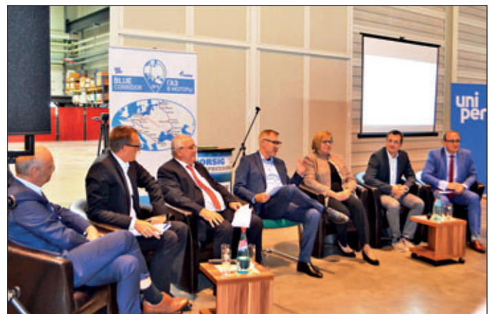
Die BORSIG ZM Compression GmbH Meerane begrüßte die Blue Corridor Tour am 16. September 2019.