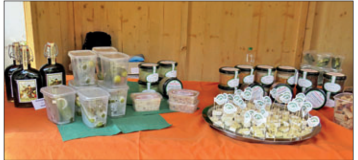
Kulinarische Spezialitäten hatten die Lörracher Partnerstädte zum Strooßefescht mitgebracht.