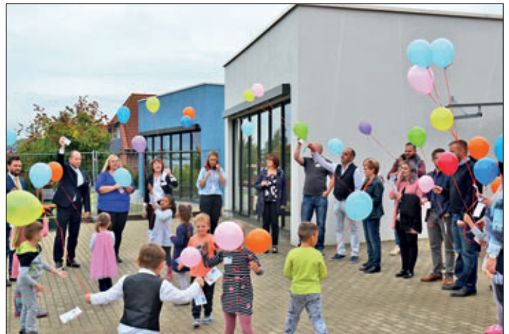
Bunte Luftballons stiegen zur Übergabe des neuen Anbaus der Kita „Arche Noah“ in den Meeraner Himmel.