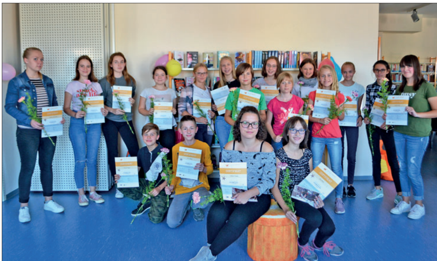
Die erfolgreichen Teilnehmer des Buchsommers Sachsen 2019 in Meerane.