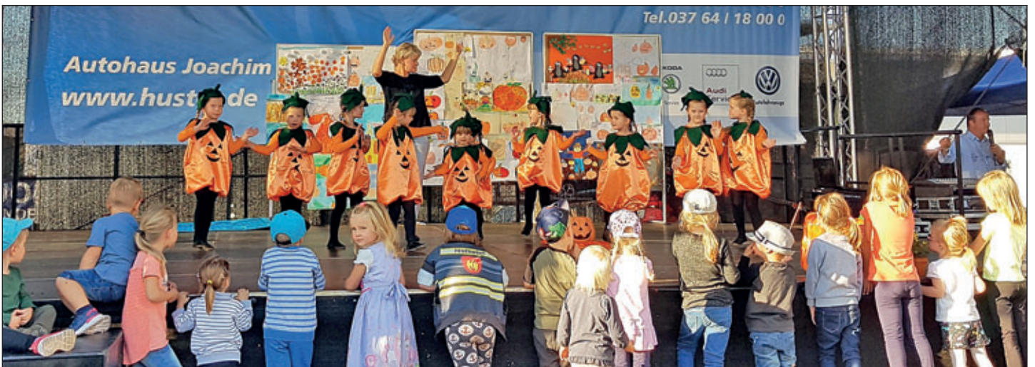
Ein vielfältiges Festprogramm erwartete die Gäste beim 21. Meeraner Kürbisfest.